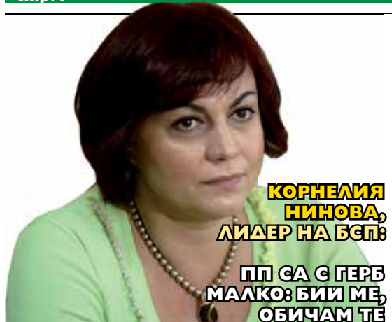
КОРНЕЛИЯ НИНОВА, ЛИДЕР НА БСП: