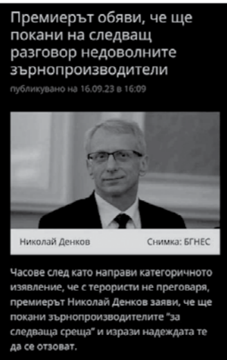
Премиерът обяви, че ще покани на следващ разговор недоволните зърнопроизводители (публикувано на 16.09.23 в 16:09)

Септември започват ефективни протестни действия в цялата страна, а на 19-и ще се стигне и до блокиране на София. На среща в Арбанаси е взето решение за безсрочен национален протест и се е формирал ИК.