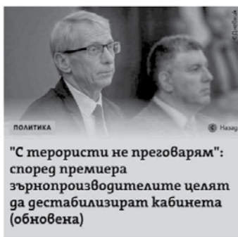
ПОЛИТИКА „С терористи не преговарям“: според премиера зърнопроизводителите цялят да дестабилизируют кабинета (обновена)

„Аз с терористи не преговарям“, заяви премиерът Николай Денков по повод подготвените протести на зърнопроизводителите у нас. Според него през последните дни зърнарите са започнали да се държат като такива. Думите му предизвикаха скандал и той покани браншовите организации на среща.