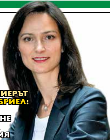
ВИЩЕПРЕМИЕРЪТ МАРИЯ ГАБРИЕЛ: