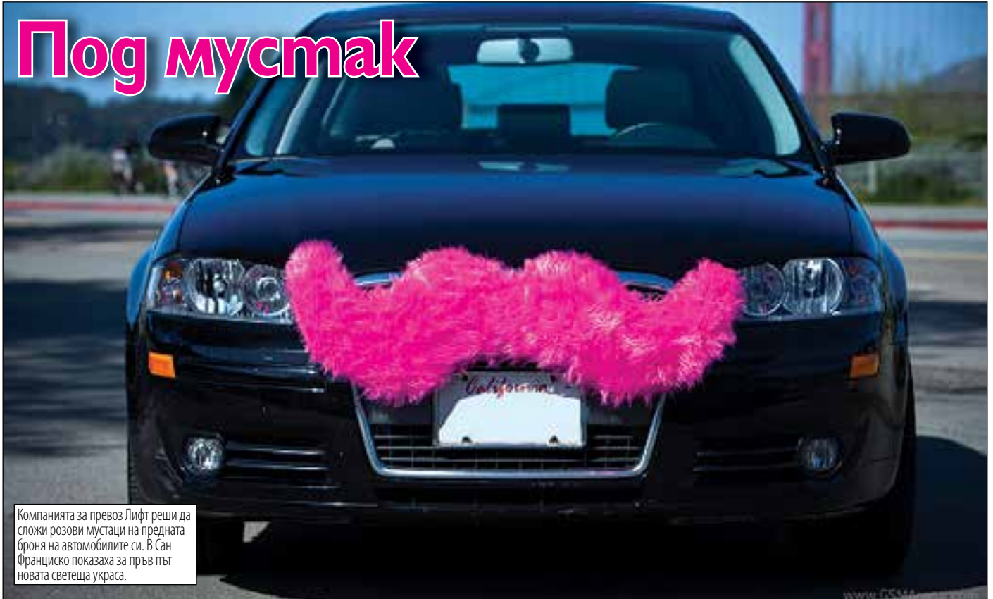
Компанията за превоз Лифт реши да сложи розови мустаци на предната броня на автомобилите си. В Сан Франциско показаха за пръв път новата светеща украса.