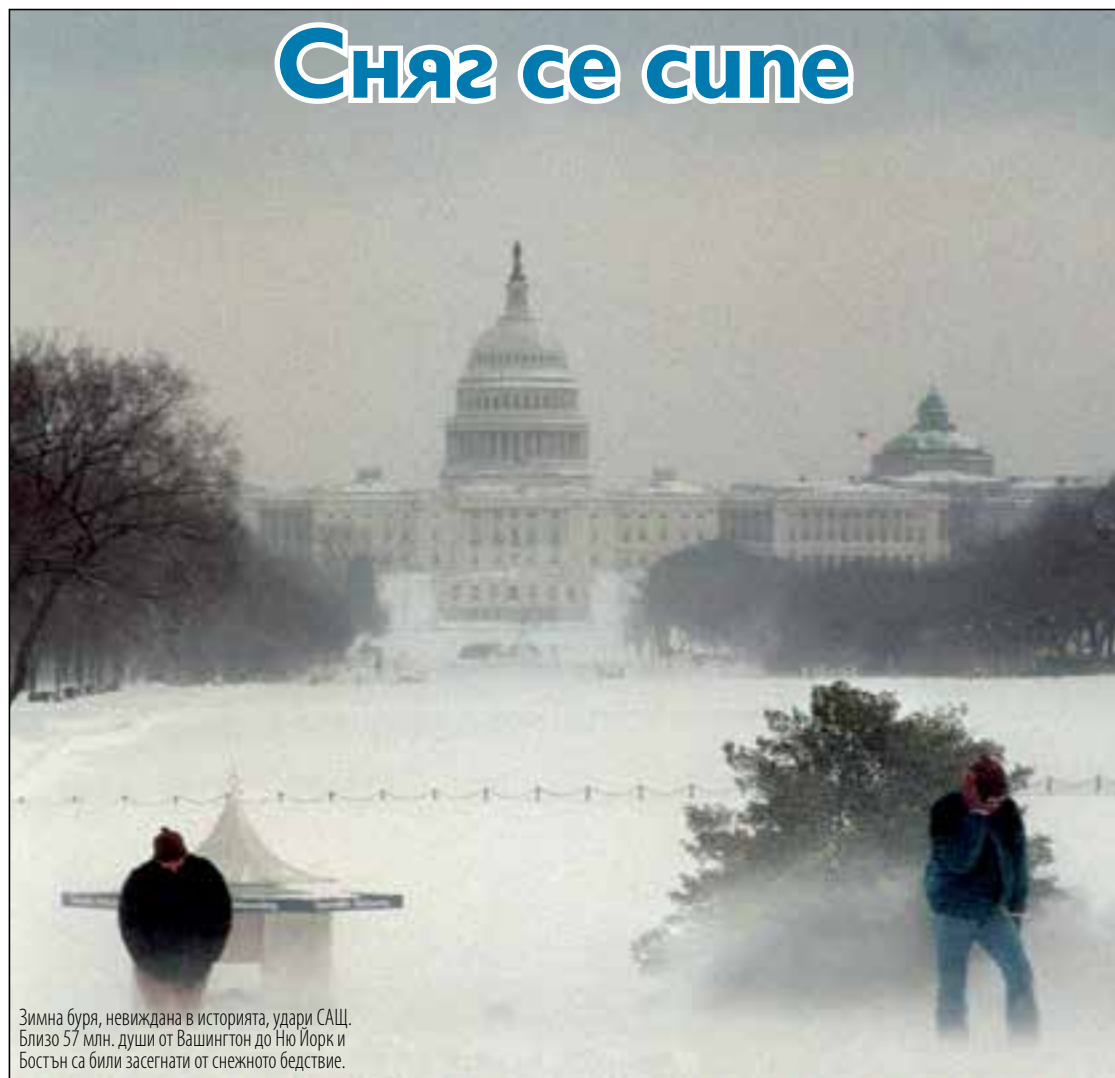
Зимна буря, невиджана в историята, удари САЩ. Близо 57 млн. души от Вашингтон до Ню Йорк и Бостън са били засегнати от снежното бедствие.